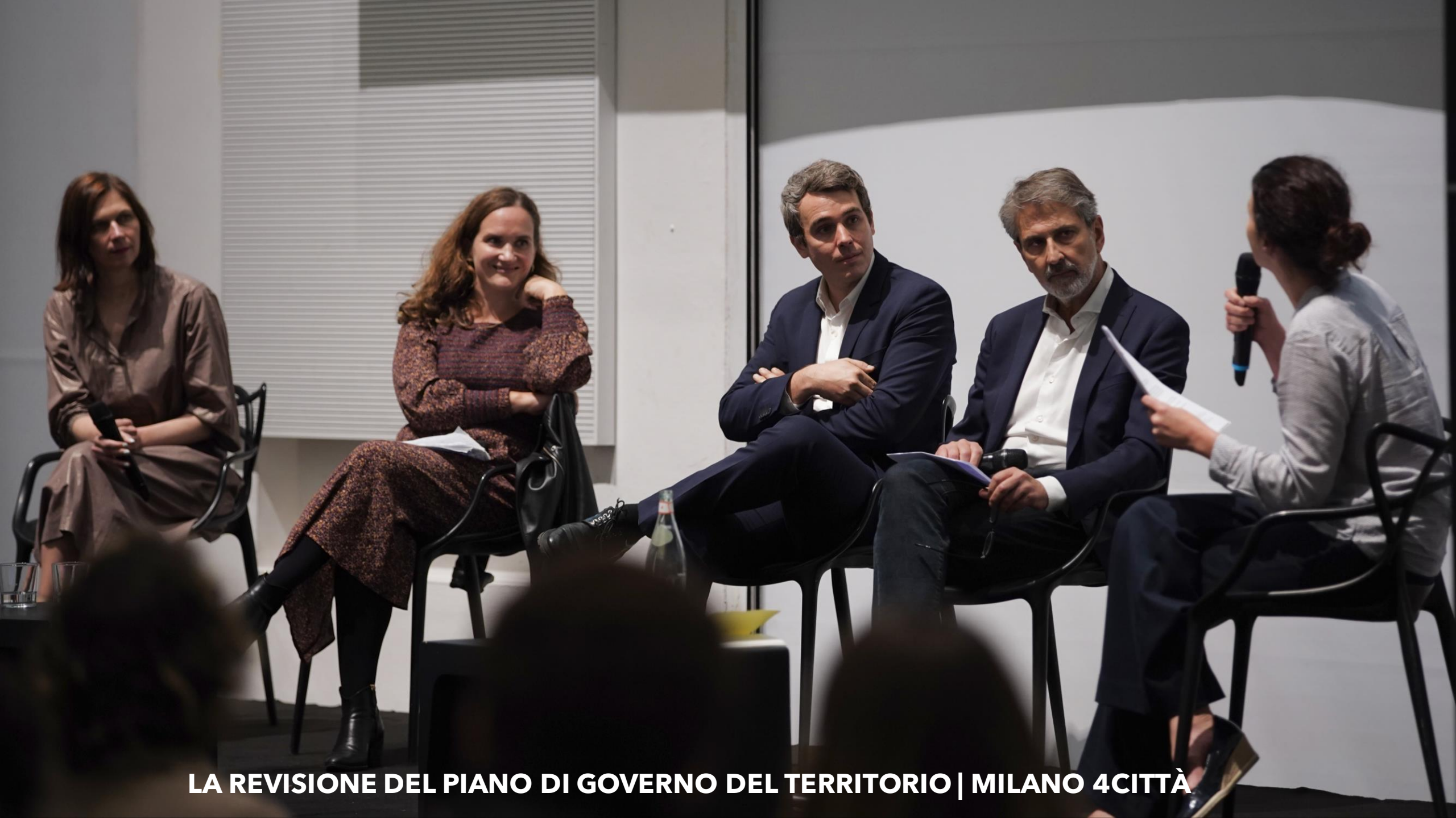
LA REVISIONE DEL PIANO DI GOVERNO DEL TERRITORIO | MILANO 4CITTÀ