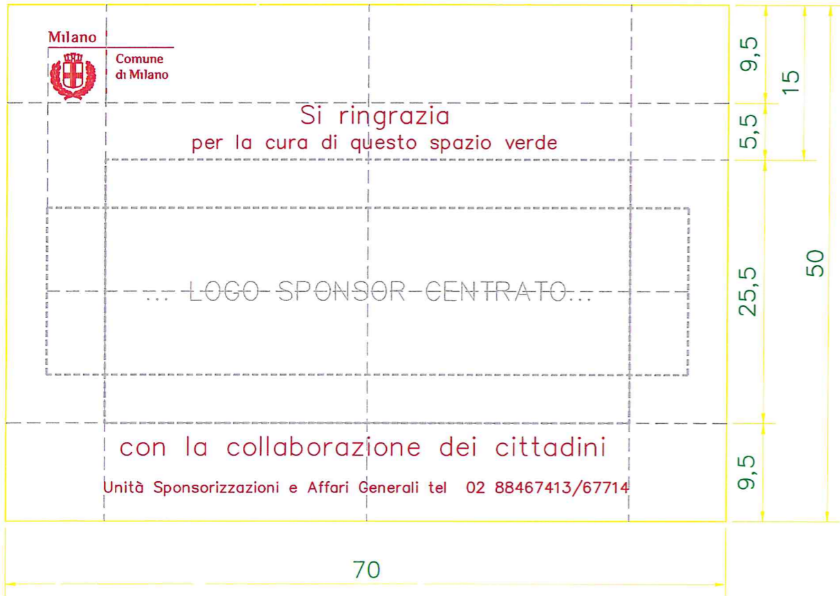
Cartello tipo A L.50 x h.70 cm

I colori istituzionali sono quelli utilizzati per la riproduzione del marchio sono codificati con il codice Pantone® (utilizzabile per la stampa su materiale cartaceo) con codice RAL (utilizzabile per la riproduzione a mezzo vernici), con il Codice 3M (utilizzabile per la riproduzione a mezzo pellicole autoadesive).